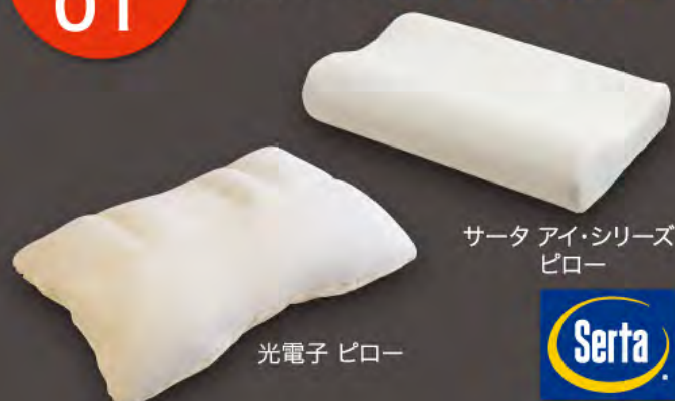
サータ アイ・シリーズ ピロー