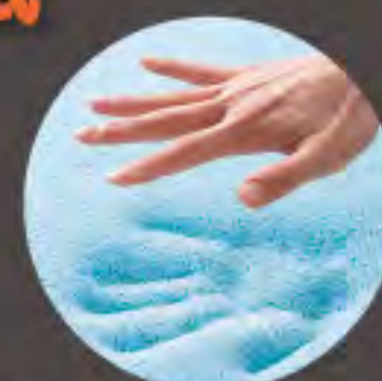
ジェルメモリーフォーム